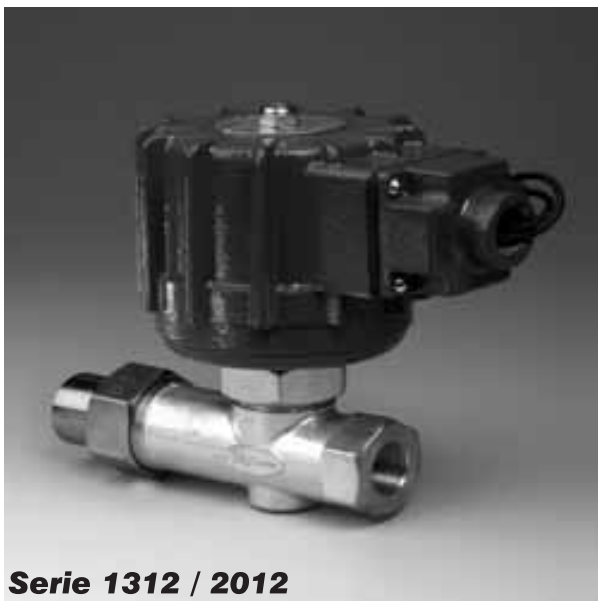
Serie 1312 / 2012